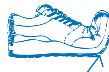
Goed buigpunt loopzool

Fasciitis plantaris duurt gemiddeld 6 tot 18 maanden. Een vroege behandeling kan de duur bekorten. Het is belangrijk de voet te ondersteunen om overrekking van de pees te vermijden. Een goede, stabiele schoen met al dan niet een corrigerende podotherapeutische inlegzool is een eerste vereiste. Wanneer u de schoen in de hand heeft, moet u de loopzool kunnen buigen bij de voorvoet. De loopzool hoort niet in het midden te buigen.