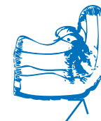
Verkeerd buigpunt loopzool

Een podotherapeut kan in sommige gevallen de pees direct ontlasten door een taping aan te leggen, waardoor de trekkracht op aanhechting van de peesplaat verminderd. Ook kan de podotherapeut u schoenadvies en rekoefeningen geven; zie hiervoor ook onze folders 'Schoentips' en 'Rekoefeningen'.